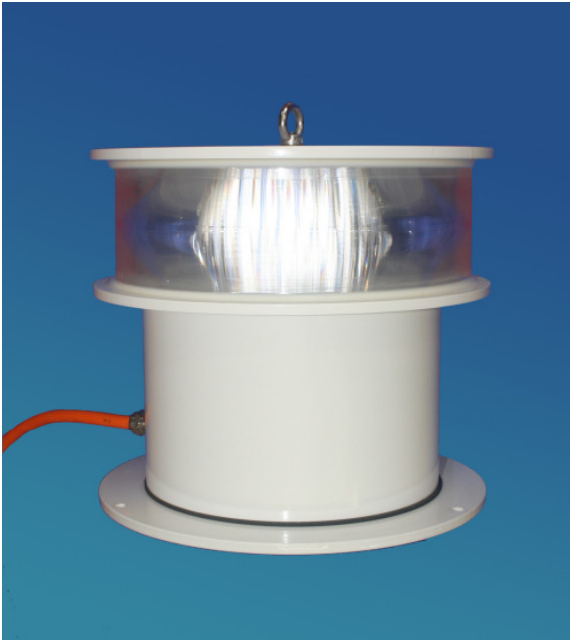
Darstellung mit integrierter Elektronik (Vorschalt-elektronik und Dämmerungsschalter)